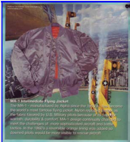
Bomber MA-1 Flying Jacket Vintage Made in USA

Qui di seguito alcuni dei modelli di cui disponiamo, puoi vedere i dettagli ed acquistare direttamente cliccando sul link sotto la immagine: